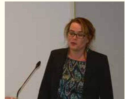
Auteur Dorine van Hoogstraten