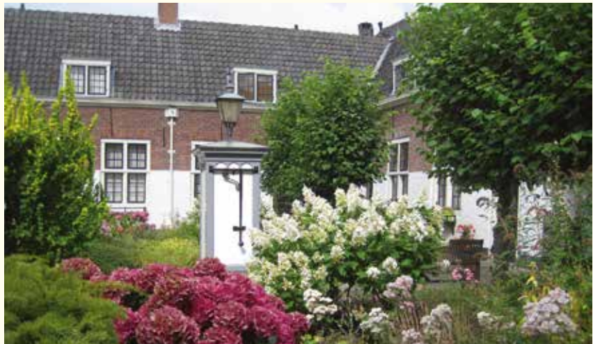
Het Bethlehemshofje.

Turck behandelt in zijn boek onder andere de ontstaansgeschiedenis van het hofje in het algemeen, aan de hand van met name de Leidse hofjes gesticht in de 15de tot en met de 17de eeuw. Daarbij besteedt hij ruime aandacht aan de redenen die ten grondslag lagen aan de bouw van een hofje, evenals aan de architectuur- en kunsthistorische aspecten van die hofjes. Van veel hofjes heeft hij bijvoorbeeld het grondplan bestudeerd, maar ook de stichtingsakten. Elk hofje in Leiden gesticht vóór het jaar 1700 wordt in zijn boek besproken. De aandacht blijft dus niet beperkt tot de blikvangers als Sint Anna Aalmoeshuis, Meermansburg en het Van Brouckhovenhofje, ook het kleine Van der Speckhofje en het wat veraf gelegen en minder vaak bezochte Tevelshofje worden er nauwgezet in behandeld. Uiteraard gaat Turck in zijn boek ook in op de ontwikkelingen in