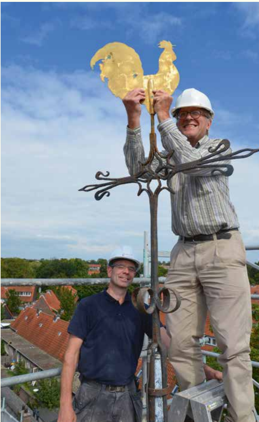
Het verwijderen van de haan betekende de start van de restauratie

De restauratie van de Sint Rochuskapel op het terrein van de stichting De Armen de Poth is onder supervisie van ir. G.W. van Hoogevest, regent bouwzaken, na enige maanden succesvol voltooid. De werkzaamheden bestonden uit het vervangen van het leien dak en de goten, herstel van metselwerk en restauratie van de klokkentoren. Ook de binnenzijde van de kapel is onderhanden genomen. Vochtproblemen zijn aangepakt, vloerverwarming is aangelegd en het koor is enigszins verkleind. Dat laatste bood de mogelijkheid achterin de kapel een houten pantry met garderobe te plaatsen. Op die manier voldoet de kapel aan de huidige eisen van de tijd bij de verhuur van de kapel. Bij de restauratie is ook dendrochronologisch onderzoek van de kap uitgevoerd. Analyse van houtmonsters van de dakspanten gaven aan dat het hout in de zomer van 1499 gekapt is. Kort erna is de kapel gebouwd. Daarmee is de kapel het oudste gebouw op het terrein van De Poth.