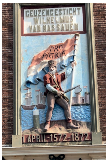
Niet alleen het Asyl, ook het gereformeerd weeshuis van Brielle dankte zijn ontstaan aan het derde eeuwfeest van de inname van Den Briel.

deze kerk ooit groter en de toren hoger dan de Domkerk in Utrecht zou worden, doelen die niet werden gehaald toen het geld op bleek. Desalniettemin is deze kerk een indrukwekkend gebouw, binnen zowel als buiten. De stad is sterk verweven met diverse gebeurtenissen uit 1572. Bij de viering van de inname in 1872 werd niet alleen het Asyl gesticht maar ook het Geuzengesticht Wilhelmus van Nassauwen, dat werd opgericht ten behoe-