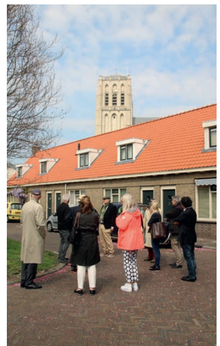
Wandelen door het fraaie Brielle.