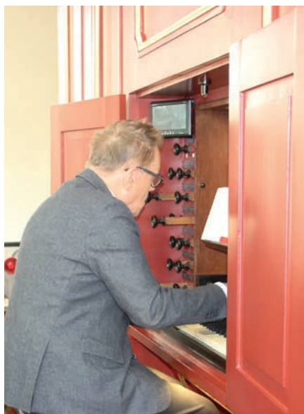
Ontvangst en orgelspel in de Sint-Catharijnekerk.

van de stad door de Watergeuzen op 1 april 1572 en de wisseling van de Grote Kerk van katholiek naar protestant op 2 april 1572. Voorts sprak hij over de 19 geestelijken afkomstig uit Gorcum die na de inname hier werden omgebracht en later heilig