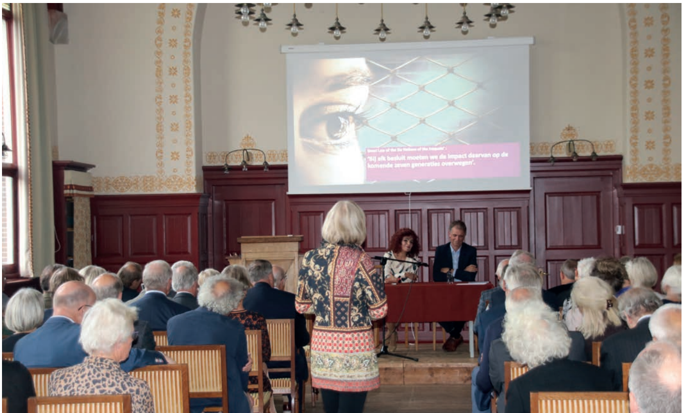
Een aandachtig publiek in de neogotische aula van het Hodshonhuis.