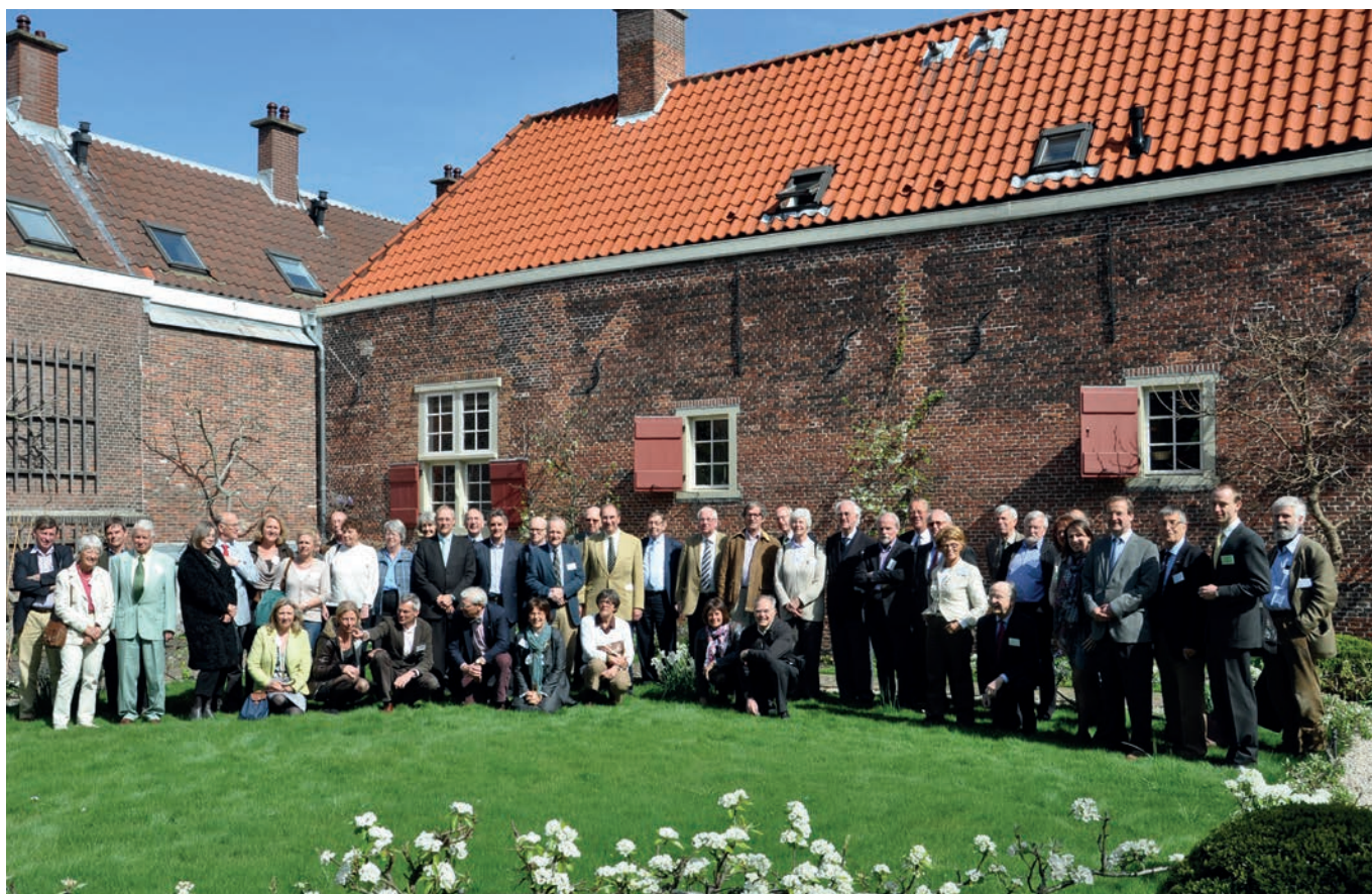
Regentenportret in het Hofje van Wouw, 9 april 2011.