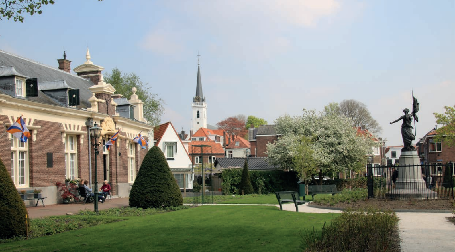
Het Asyl voor Oude en Gebrekkige Zeelieden, vrolijk vlaggend op deze mooie dag. Rechts de Nymf van de Vrijheid.