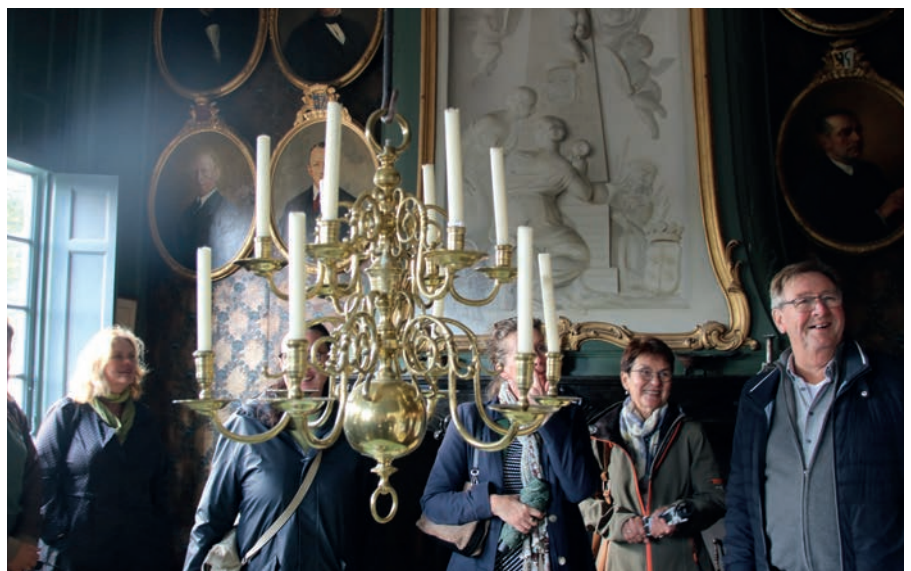
De fraaie regentenkamer van Staats & Noblet.