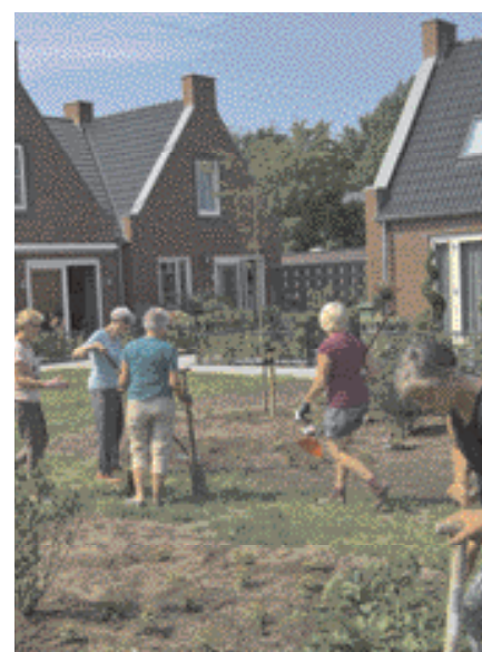
Gezamenlijk tuinieren is een van de activiteiten die knarrenhofbewoners kunnen ondernemen.