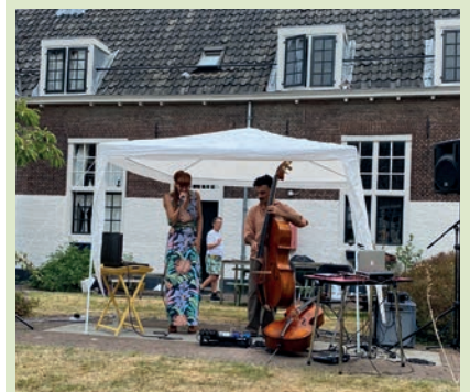
Musici traden weer op in de Leidse hofjes.

De Leidse hofjesconcerten werden in september 2021 voor het eerst na de coronapandemie weer georganiseerd. Het festival lijkt zijn vaste plaats in de Leidse agenda wederom veroverd te hebben, zij het niet meer met Pinksteren maar in september. De concerten werden gegeven op 30 locaties, waarvan 25 in hofjes. Ook dit jaar werden de concerten zeer goed bezocht. Traditiegetrouw komt een zeer uitgebreide waaier aan muziekstijlen aan bod, dat was ook nu weer het geval: van klassiek tot wereldmuziek en jazz. Verrassend was het optreden van kamerkoor Het Zingende Hart, die met acteurs in vroeg 20ste-eeuws kostuum een muzikale stadwandeling maakte langs dezelfde route die Mahler en Freud door Leiden liepen in 1910. Het optreden vormde een mengeling van theater en zang. Een impressie van de concerten is terug te vinden op de website www.leidseglibber.nl/videos .