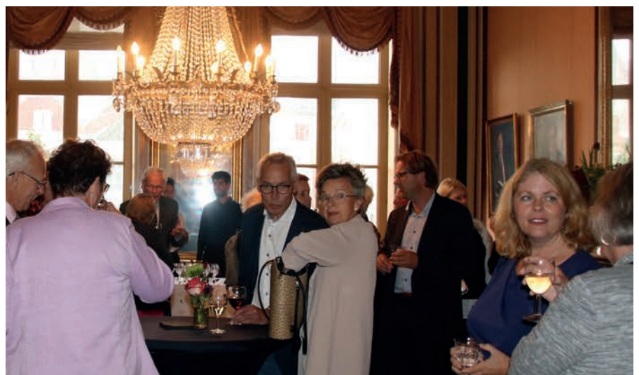
Een levendige feestborrel.