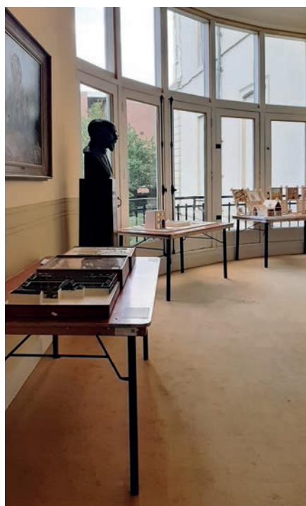
Delftse maquettes in de wandelgangen van het Haarlemse Hodshonhuis.