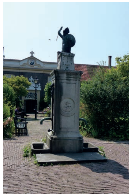
De regentenkamer van Meermansburg, het grootste hofje van Leiden.