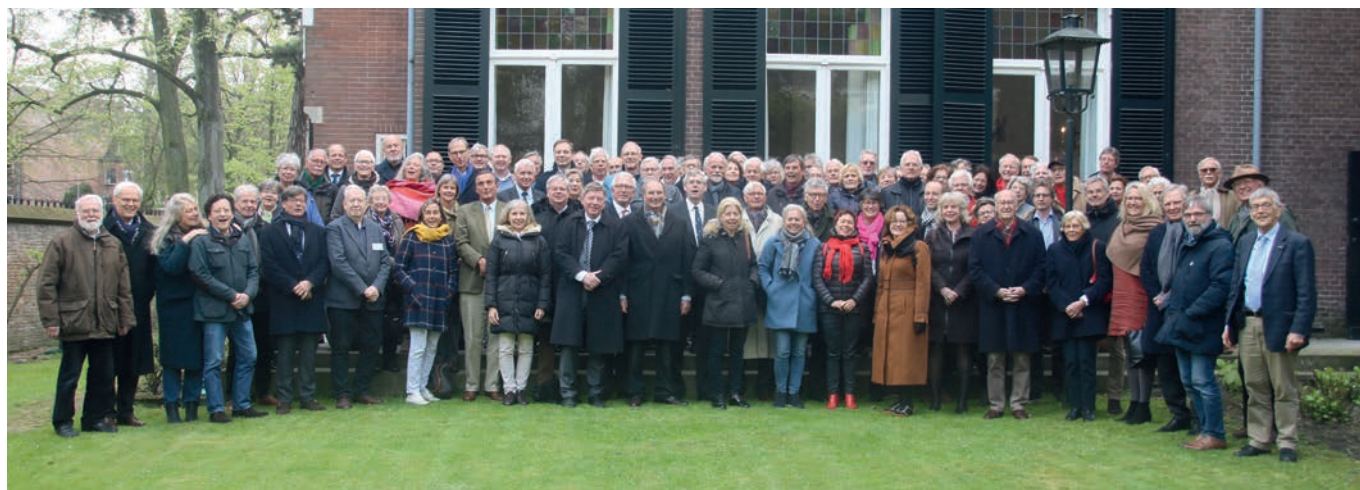
Regentenportret in het Begijnhof te Breda, 13 april 2019.