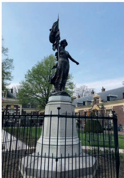
De Nymf van de Vrijheid.

ve van gereformeerde wezen. Op de gevel prijkt een stoere geus met een Nederlandse vraag en een fez-achtig hoofddeksel met daarop een halve maan, een herinnering aan de geuzenleus 'liever Turks dan Paaps'.