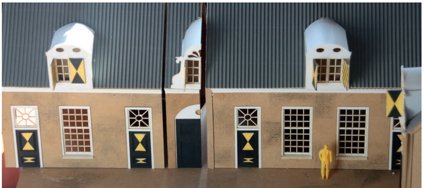
Maquette van het Hofje van Staats.

De laatste jaren is het LHB steeds meer bezig met gezamenlijke belangenbehartiging richting de landelijke overheid, door de verhuurderheffing en nu door het steeds grotere vraagstuk van verduurzaming. Door middel van de Hofjesreeks, de Hofjeskrant en bezoeken over en weer