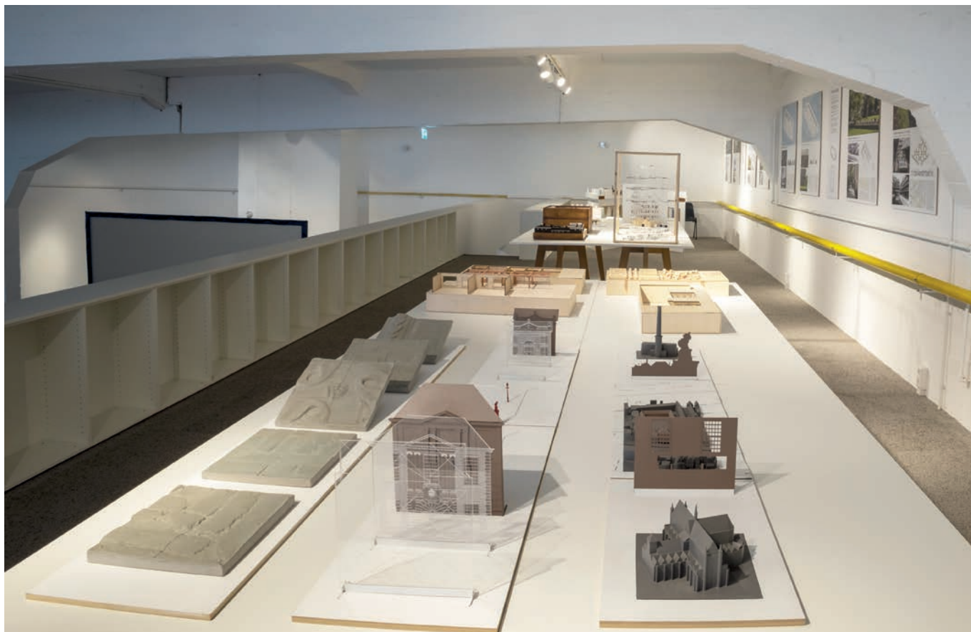
De tentoonstelling bij het KeileCollectief in Rotterdam.

Een derde bijzonderheid is dat de eeuwenoude hofjestradiatie in het ontwerp van nieuwe hofjes altijd rekenschap aflegt ten opzichte van het archetype (voordeuren van de huizen aan het hofje, de achterkant een dichte gevel, een gereguleerde toegang tot een binnenterrein) én de eigentijdse