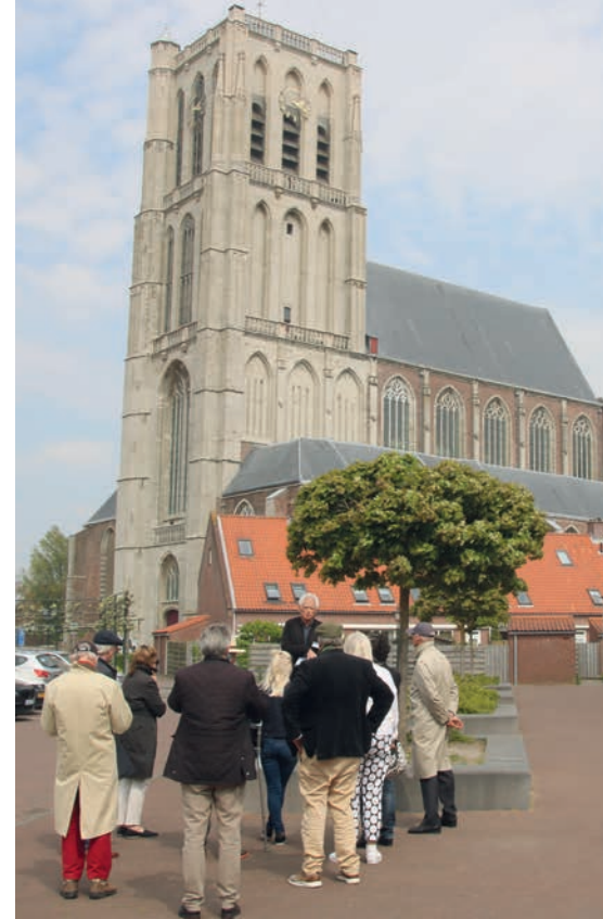
In en om de Sint-Catharijnekerk.