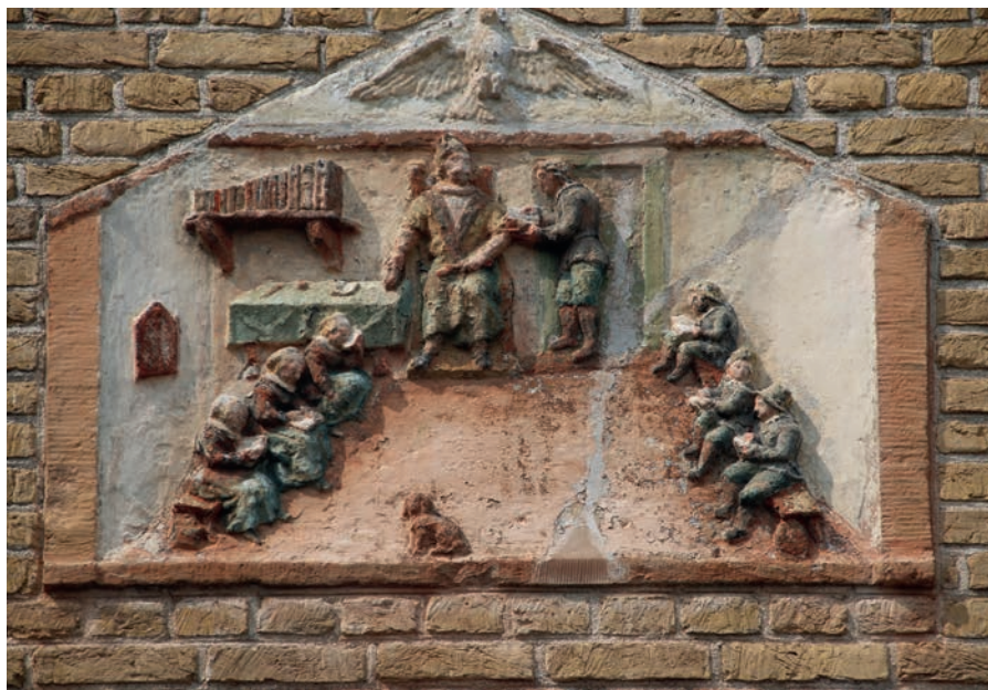
Gevelsteen met interieur van een 17de-eeuws schooltje.

Er werd ook een bezoek gebracht aan de bedevaartskerk gewijde aan de Martelaren van Gorcum, gebouwd op de plaats waar