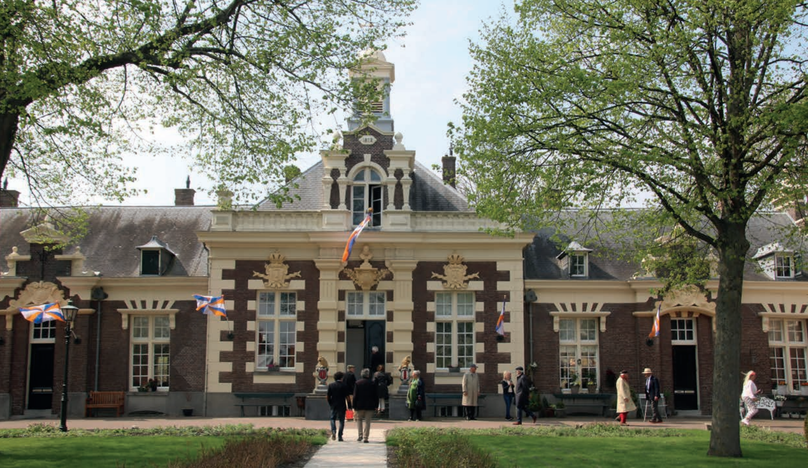
Het fraaie regentenhuis van het Asyl. Brielse geuzenvlaggen wapperen aan de gevel van het Asyl.

verkrijgen en wordt woningbouw naast de aanleg van zonnevelden mogelijk. De provincie heeft deze locatie al eerder aangewezen als mogelijk geschikt voor zonnevelden en binnenkort volgt daar nog overleg over.