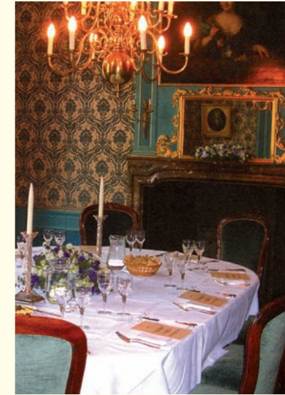
Feestelijke dinertafel in de regentenkamer, begin eenentwintigste eeuw