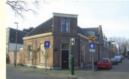
Stichting Fundatie Sint Margaretenhof

den worden onderhouden voor alle gaende ende comende lantlopers." In 1603 bleek het gasthuis "tegenwoordelijck onderscheyden te zijn in achttien camers." De in totaal 26 bewoners ontvingen ieder maandelijks één gulden en veertien zakken turf. Een echtpaar ontving een daalder en 26 zakken turf. In 1810 was inmiddels sprake van 20 kamers of woningen. Elk huis bestond uit een kamer. Behalve gratis huisvesting ontving iedere bewoner jaarlijks 9 gulden, 14 zakken turf en 20 ponds-broden.