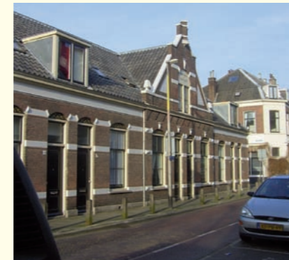
Eleemosynae van Oud Munster

Op 26 maart 1418 overleed Everard Foeck, deken van het kapittel van Oud-Munster, die in zijn op 6 april 1400