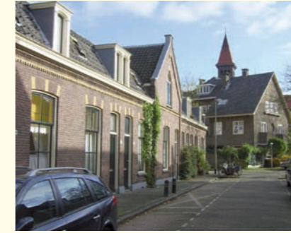
Fundatie Tullingh's Stichting

gemaakte testament onder meer 50 armenpreuves had ingesteld. Die preuves werden uitgedeeld in de heilige Kruiskapel, later bekend als de Thomaskapel. "Eleemosynae" betekent aalmoezen en "Oud-Munster" is een andere benaming van de in 1587 afgebroken St. Salvatorkerk. In 1542 liet de kanunnik Johan van Medemblick 37 vrijwoningen na en de kanunnik Jan Mersman voegde daar in 1601 nog 7 vrijwoningen aan toe. In 1609 voegde de pastoor van de Buurkerk nog 6 armenpreuves toe. De doelstelling bleef de armen door uitdelingen en gratis huisvesting uit de nood te helpen. De stichting bezit 7 woningen en enkele stukken weiland.