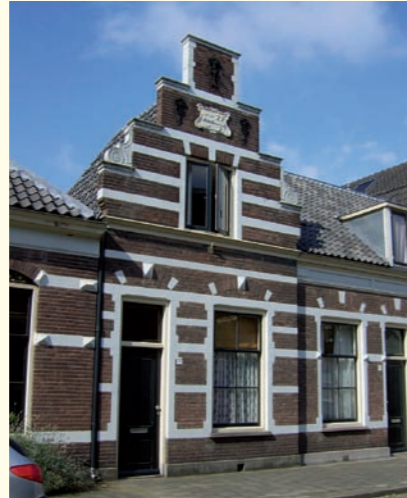
Kamer van Hoogelanden

Statuten of een stichtingsacte zijn niet bekend. Wel bekend is een transportacte van 25 juni 1715, waarbij aan het gerecht