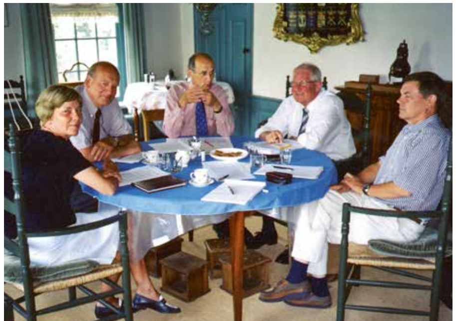
Filosoferen in de Herenkamer over de definitie van een hofje.

kwam hij naar landelijke bijeenkomsten. Ook enkele meer persoonlijke contacten met hem en zijn vrouw werden voortgezet, tot dat dit niet meer mogelijk bleek.