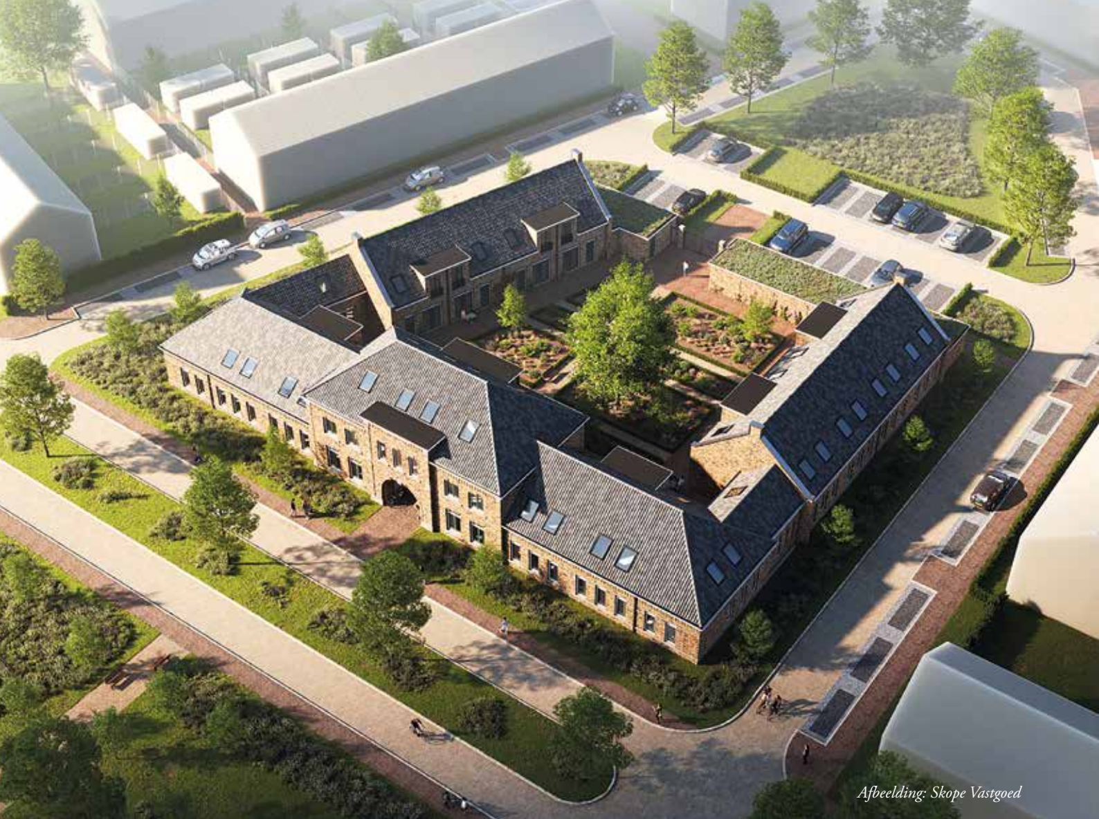
Afbeelding: Skope Vastgoed