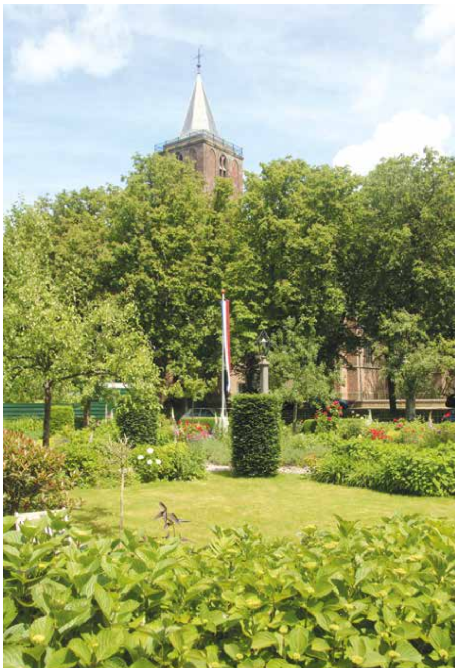
Hier en op de volgende bladzijde fotografische impressies van de bijeenkomst in Edam.

dacht hoe geliefd in de gemeente de tuin van het Proveniershuis is voor het maken van bruidsfoto's. 'Een vruchtbaar hofje', kortom.