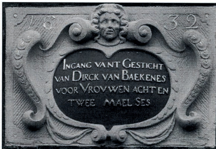
CARTOUCHE UIT 1632 BOVEN DE TOEGANGSDEUR AAN DE BAKENESSERGRACHT

Dit boek is een juweeltje in iedere regentenkamer of boekenkast. Het is uitgegeven bij De Vrieseborch in Haarlem als nr. 42.