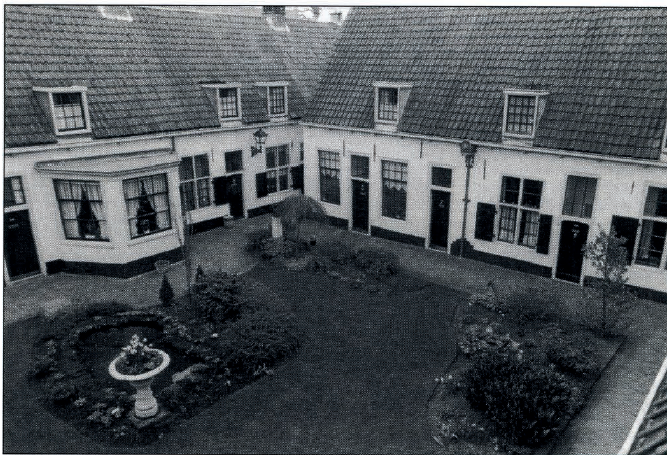
DE LICHTE BINNENPLAATS, GEZIEN VAN EEN VAN DE DAKEN