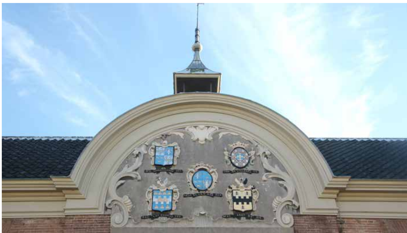
Voorgevel van het Hofje van Mevrouw van Aerden, met wapenschilden van de eerste regenten en die van de stichteres in het midden.

Een aanvraag kan het hele jaar ingediend worden, mits voorafgaand aan de start van de werkzaamheden, en kan bijvoorbeeld worden aangevraagd voor verduurzamings- en energiebesparende maatregelen. De hoogte van de lening wordt gebaseerd op een begroting van een aannemer en kent een maximum van 1 miljoen euro. De financiering wordt beoordeeld op basis van de jaarcijfers van de aanvrager. Als zekerheid wordt een hypotheek gevraagd. Het Restauratiefonds ver-