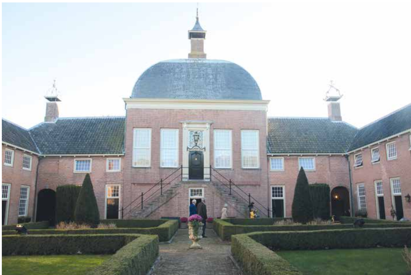
Het hofje aan de binnenkant met het fraaie regentenhuis met zijn kenmerkende koepel.