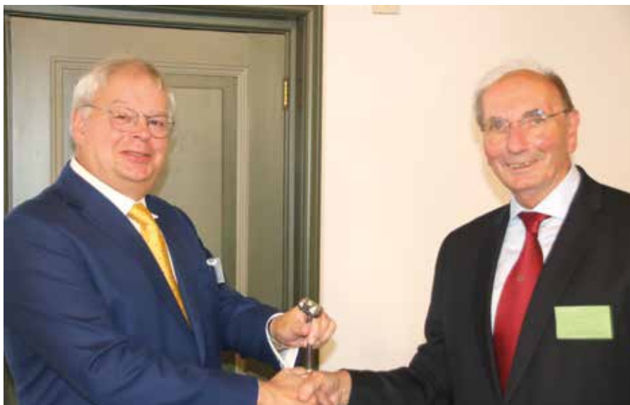
De komende en scheidende voorzitter.