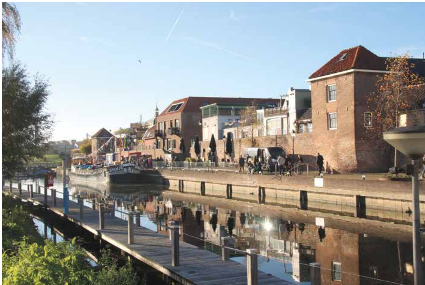
Wandeling langs de Linge naar de glasfabriek.

strekt zelf geen subsidies, maar voert deze uit voor de Rijksdienst voor Cultureel Erfgoed. De hofjes Van Wouw in Den Haag en Staats & Noblet in Haarlem hebben goede ervaring met de financiering van het Restauratiefonds.