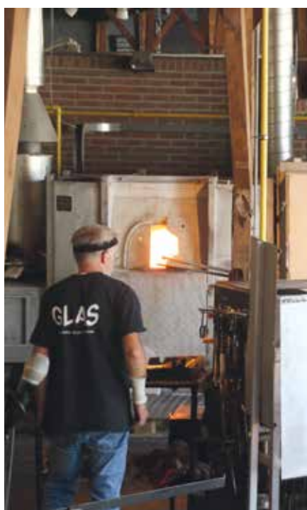
De glasblazer aan het werk.

De notulen van de Najaarsvergadering zijn de deelnemers inmiddels toegestuurd.