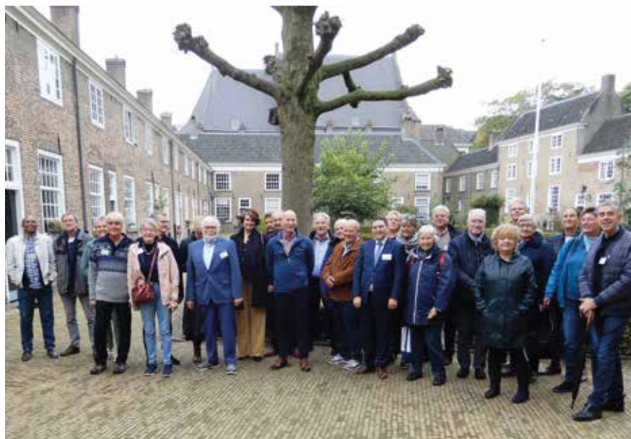
De huismeesters bijeen in het Bredase Begijnhof.