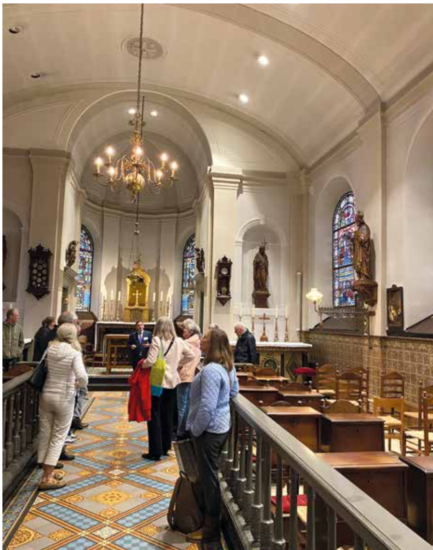
De huismeesters kregen uiteraard een rondleiding door het fraaie Bredase Begijnhof.

lieke kerk te stichten in het Begijnhof, de huidige Catharinakerk. In 1990 overleed de laatste begijn, waarna het Begijnhof eigenlijk meer een hofje is geworden.