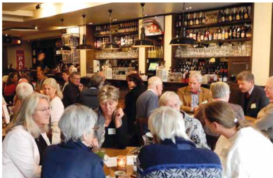
Tijdens de smakelijke lunch werd ook gesproken over geestelijke voeding.