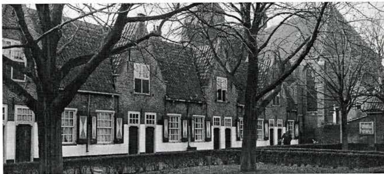
HET HEILIGE GEESTHOFJE IN NAALDWIJK.