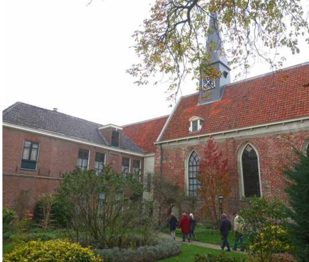
Pelsterkerk en binnentuin van het Heiligen Geest Gasthuis.

Na de lezing werd de voorzitters van het Heiligen Geest Gasthuis en Sint Anthony