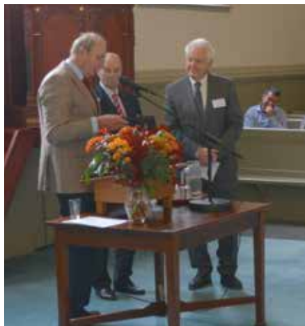
Overhandiging van de LHB-steentjes.

runnen van een kleine woningcorporatie, met als extra uitdaging het in stand houden van het monument. Hij zag in dat kader de toegevoegde waarde van de verbindende inspanningen van het LHB. Er is immers veel nieuwe wet- en regelgeving die op alle afzonderlijke besturen tegelijk af komt, en door kennis te bundelen en uit te wisselen via het Hofjesberaad hoe-