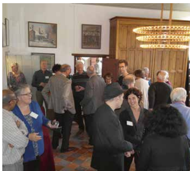
Geanimeerde lunch en borrel.