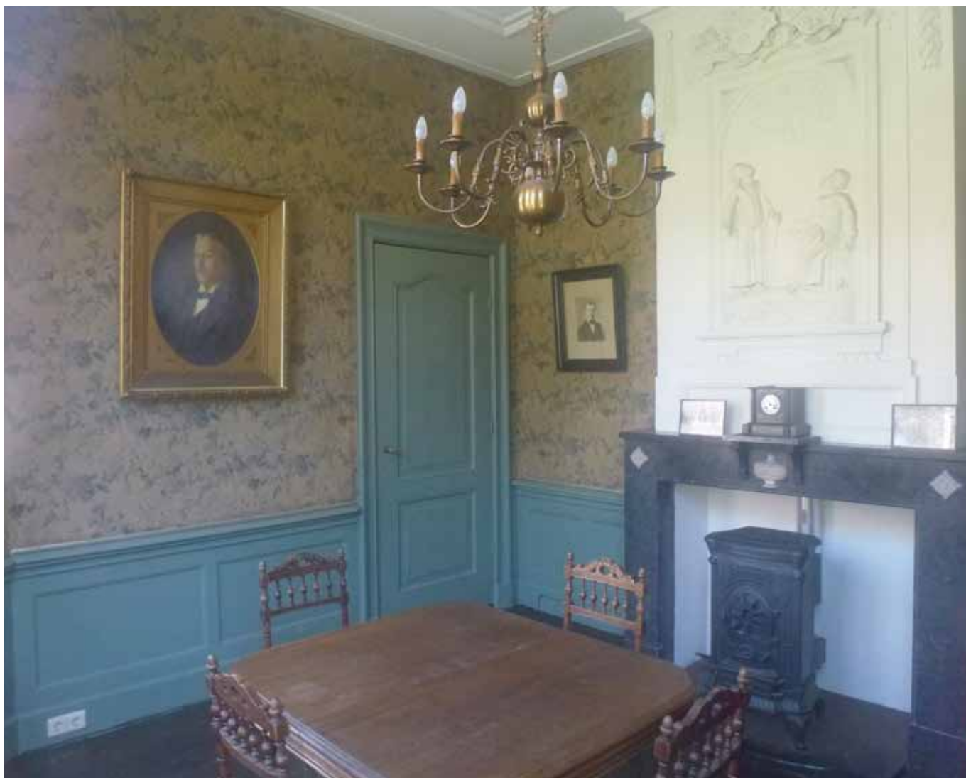
In het hofje van Barent van Namen gaan 18de-eeuwse en 20ste-eeuwse elementen een goed huwelijk aan.