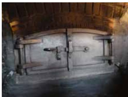
Brood bakken in De Armen de Poth.

Komend voorjaar en in de zomer staan diverse andere zaken op stapel. Op 30 april en 1 mei vindt het langverwachte Engelse bezoek plaats. Dan brengen de voorzitter van de Engelse Almshouse Association en de Chief executive van de Tiverton Almshouse Trust een bezoek aan