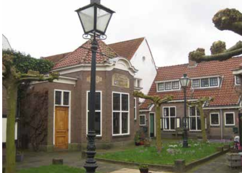
Hofje van Barent van Namen, Leiden.