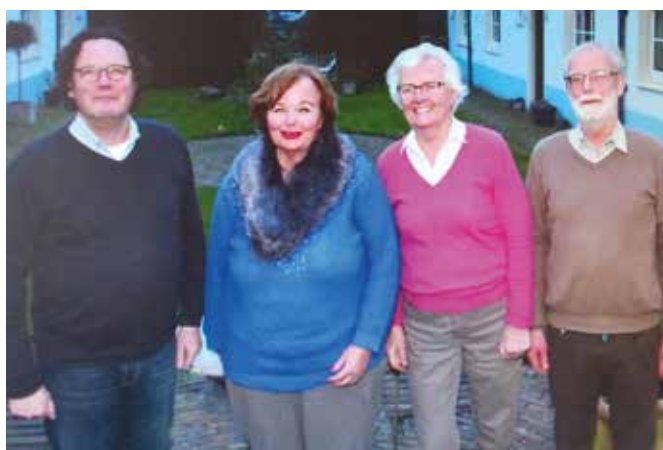
Doorkijkjes in het Anthony- en Vrouwegasthuys; vier leden van het regentencollege.

huisden kort daarop naar het verbouwde hofje.