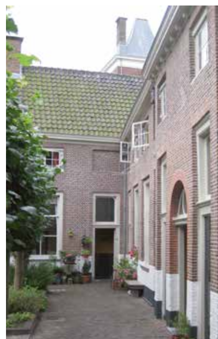
Het Tevelingshofje: wie goed kijkt, ziet dat de hoeken geen 90 graden hebben.

een voorbeeld voor het wat later gebouwde Jean Pesijnshofje. Er werd in de loop der tijden doorgaans goed voor het hofje gezorgd, ondanks mindere tijden in met name de 19de en 20ste eeuw, met onder andere als gunstig resultaat het behoud van het fraaie Hollands Classicistisch ontwerp en de in 1783 fraai verbouwde regentenkamer, die grotendeels ongeschonden de eeuwen heeft doorstaan. De portretten en de familiewapens van de stichters werden toen verwerkt in de betimmering, terwijl er ook een schouw werd aangebracht met de wapenschilden van de eerste twee regenten. Het hofje werd voor het laatst in de jaren 1978-1980 grootscheeps gerenoveerd en aangepast aan moderne woonwensen, maar sindsdien vinden regelmatig aanpassingen en verbeteringen plaats om het hofje in stand te houden. Onderdelen zijn recent nog gerestaureerd, zoals in 2008 het opmerkelijke behang in de regentenkamer, dat van linnen is maar op papieren behang moest lijken.