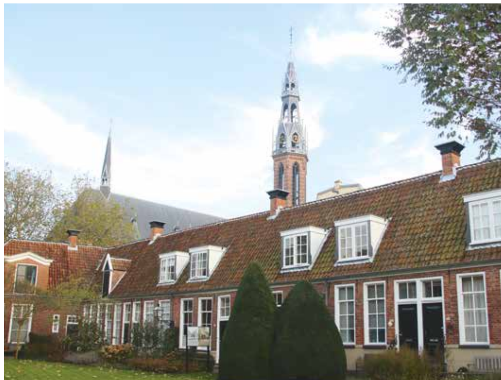
Binnentuin van het Sint Anthony Gasthuis.