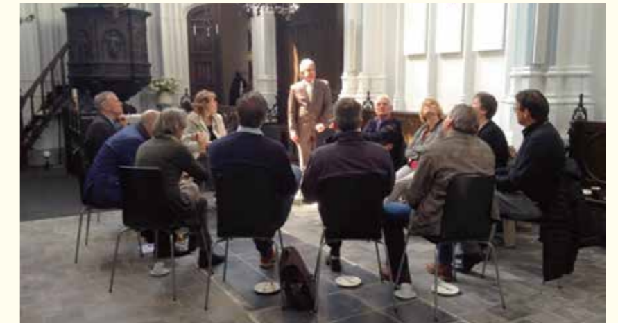
Kennisuitwisseling op 30 april 2015 in de Lutherse kerk te Den Bosch.

De Landelijke Federatie Het Behouden Huis (zie ook www.federatiebehouden-huis.nl ) is opgericht op 7 december 1974 en heeft zich als doel gesteld het behoud te bevorderen van beeldbepalende gebouwen, die geplaatst zijn of worden op de Rijks-, Provinciale- of Gemeentelijke monumentenlijst, en gebouwen in een beschermde stads- of dorpsgezicht. Het is een overkoepelende belangenbehartigingsvereniging en overlegorgaan waarbij al meer dan veertig actieve Stadsherstelorganisaties en andere organisaties op het gebied van monumentenbehoud zijn aange-