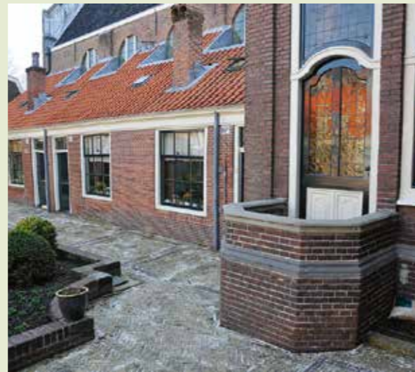
Gezicht op de huisjes en de buitenpreekstoel van het Luthers Hofje.

's Middags zal er langs een aantal Haarlemse hofjes naar het Noordhollands Archief worden gewandeld, waar ook de borrel zal worden gehouden. Het exacte programma is de leden inmiddels via email toegezonden.