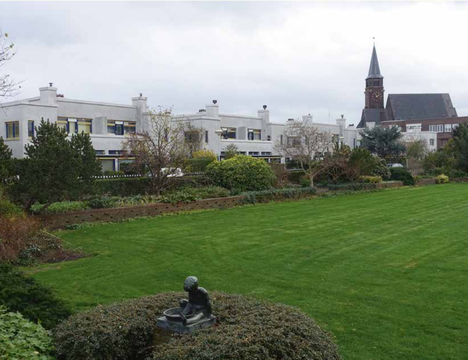
Gezicht op het Papaverhof te Den Haag, gastheer van de Najaarsbijeenkomst 2015.