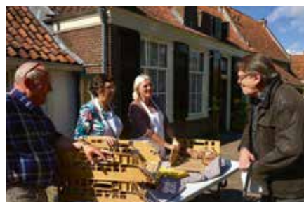
...die bij de binnenmoeder als zoete broodjes over de toonbank gingen.