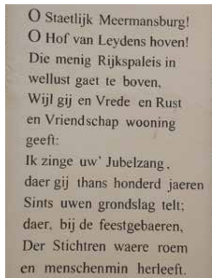
Gedicht over Meermansburg.