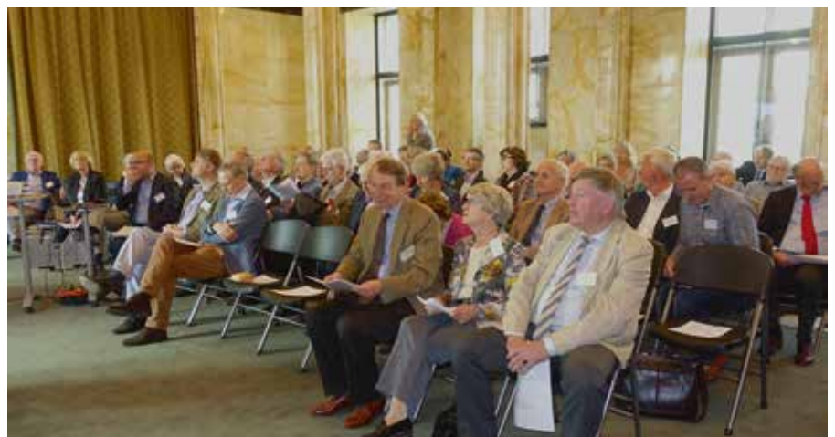
Een aandachtig publiek in de Leidse Burgerzaal.