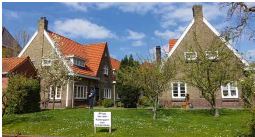
Het Cathrijn Jacobsdochterhofje vanaf het water.

de gebouw van het diaconaal centrum De Bakkerij, in het verre verleden de plaats waar door de diaconie bedeelde armen hun wekelijkse portie door de diaconie gebakken brood mochten komen ophalen. De Bakkerij is ook het hoofdkwartier van de bestuurders van de Stichting Hofjes.