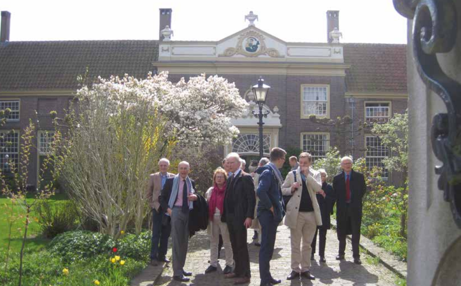
De wandeling voerde onder meer door de tuin van Hofje Meermansburg.