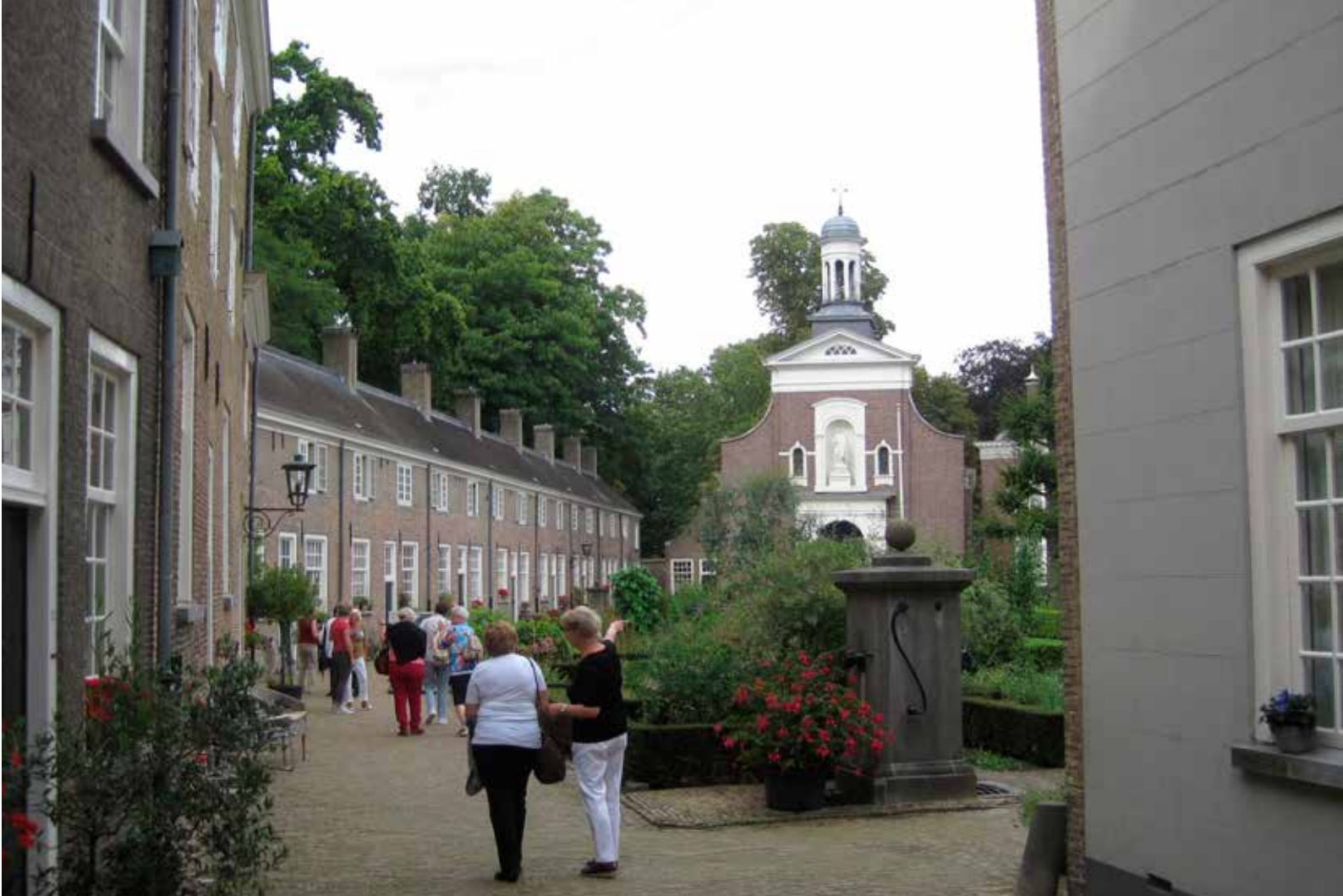
Congresgangers bezichtigen het begijnhof.