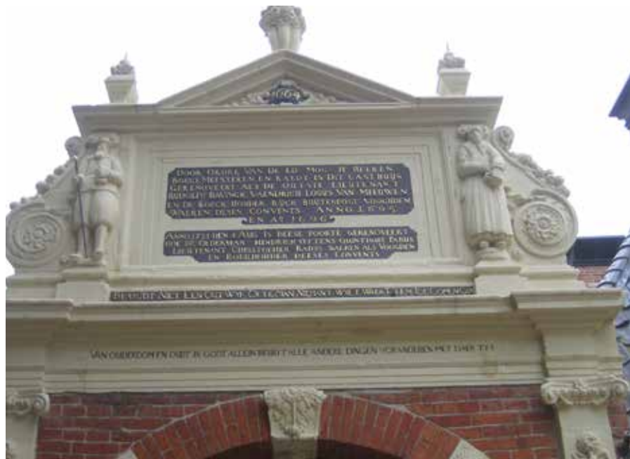
Opschrift boven de toegangspoort van het Sint Anthony Gasthuis.

Het Sint Anthony Gasthuis is dit jaar gastheer van de Najaarsbijeenkomst van het LHB, samen met het Heiligen Geest Gasthuis, dat dit jaar het 750-jarig bestaan viert. Aan de andere kant van het land viert een bijzondere instelling ook het 750-jarig bestaan, het Begijnhof te Breda. Elders in dit blad valt meer te lezen over de uitgebreide feestelijkheden die het Begijnhof dit jaar ontplooit. Als onderdeel van het herdenkingsjaar zijn dit jaar een tweetal boeken uitgebracht over de geschiedenis van het begijnhof. In Het Begijnhof van Breda. Gebouwen vol geschiedenis van de hand van bouwhistoricus John Veerman komt met name de bouwgeschiedenis van het Begijnhofcomplex aan de orde; Het Bredase Begijnhof in veranderende tijden. Een geschiedenis van 750 jaar , geschreven door een keur van auteurs, is een wetenschappelijk verantwoorde algemene geschiedenis van het Begijnhof door de eeuwen heen. Beide