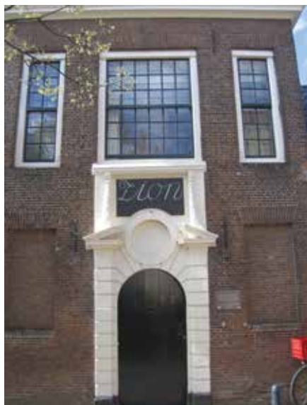
De poort van het Zionshofje.