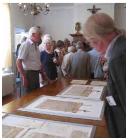
Akten uit het begijnhofarchief.

van het LHB. In België stierven de traditionele begijnen in 2013 uit, waarmee een einde kwam aan een bijzondere leef-