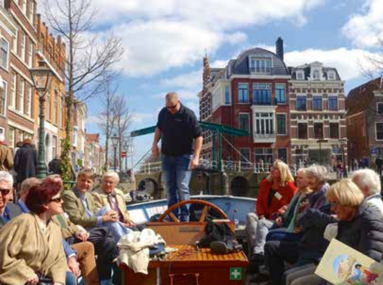
Voorjaarsbijeenkomst in Leiden.