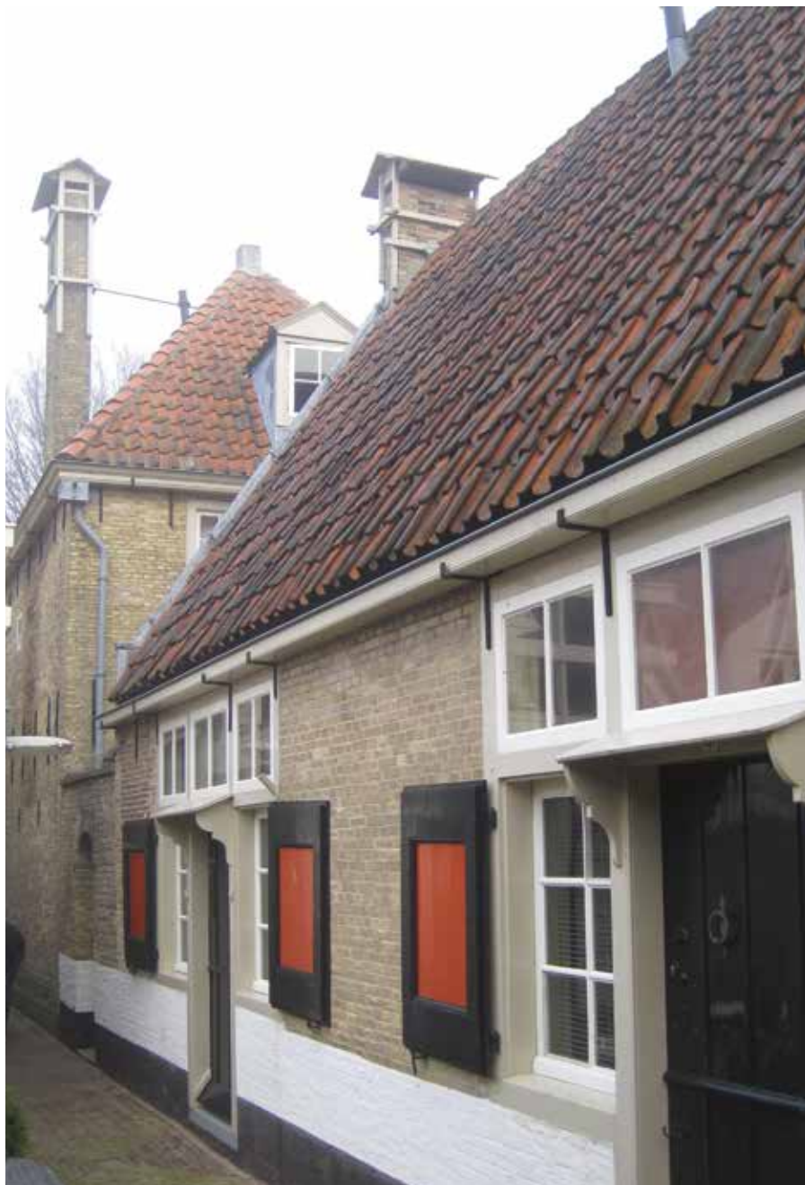
Linksboven de gevelsteen van het Pious Gesticht, linksonder stucco afbeelding van de Tijd in het Liefdadig Gesticht, rechts het Pious Gesticht vanaf de binnenplaats.

in één keer uit de financiële zorgen was en de wezen kon terugroepen uit de landbouwkolonies van de Maatschappij voor Weldadigheid in Drenthe en Groningen. Ze bepaalde daarnaast dat haar huis een tehuis zou worden voor arme lidmaten van de Hervormde kerk, te weten gezinnen en ouderen. Het 18de-eeuwse pand staat daarom tegenwoordig bekend als het Weduwenhuis. Het bevat nu zeven woningen en één stijkkamer, de Pachtkamer. Het 18de-eeuwse behang daarvan komt uit de toenmalige Behangselfabriek te Hoorn, opgericht door de Hoornse Vaderlandse Maatschappij als onderdeel van een campagne het economisch verval van de Westfriese stad te keren en mensen werk te kunnen verschaffen. De Pachtkamer