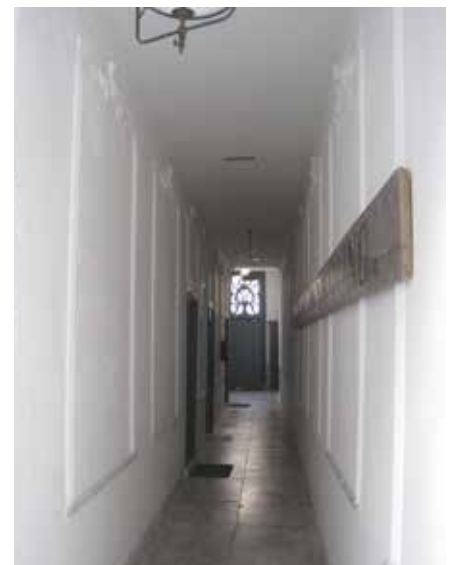
Links achterzijde van het Pieus Gesticht, rechts binnenplaatsje en gang van het Liefdadig Gesticht.