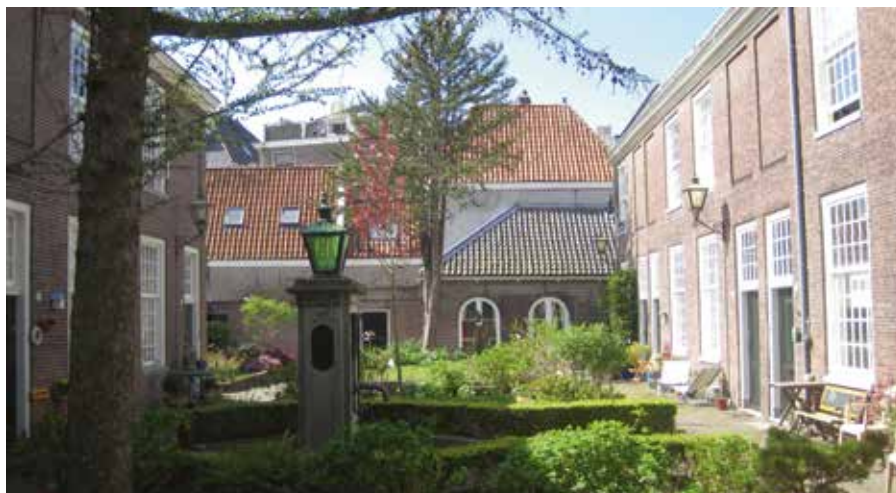
Binnenplaats van het Coninckshofje.

Het ochtenddeel van de bijeenkomst werd tenslotte afgesloten met de overhandiging van het traditionele bedankje voor de gastheer van de bijeenkomst, het bekende hofjessteentje. Daarna volgde een korte wandeling naar de lunch in het eeuwenou-