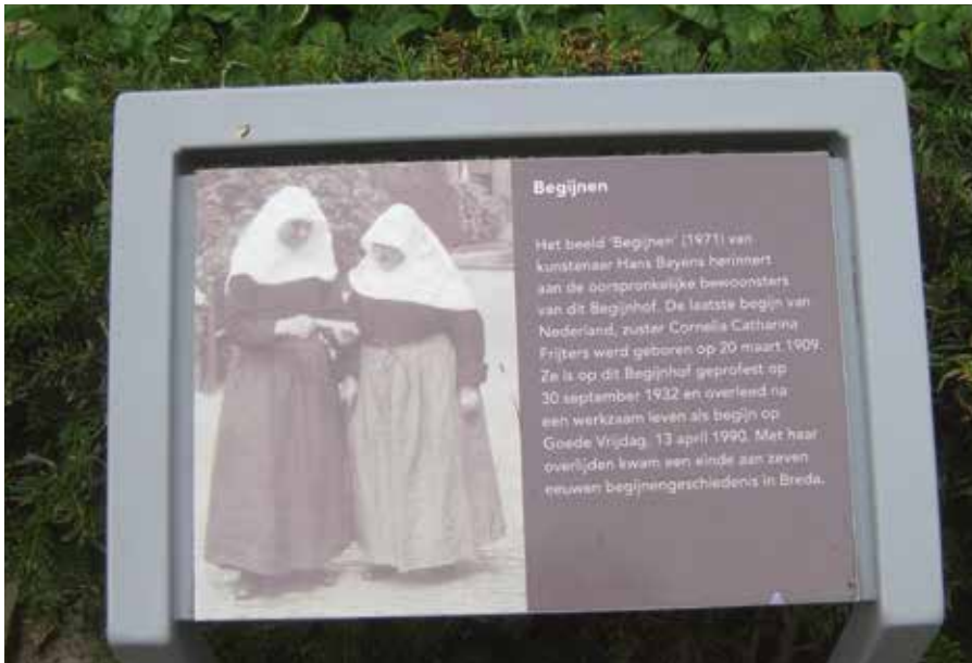
Informatie voor de bezoekers van het begijnhof.

deleeuwse gelovigen – van kerkvorsten tot dienstdoden – om te komen tot een diep gevoeld godsgeloof, tot een diepere, ‘tweede’ kerstening nu dat het grootste deel van Europa het christendom had aangenomen. Ze laten zien hoe vrouwen als begijn in staat waren uit te stijgen boven de beperkte mogelijkheden die middeleeuwse vrouwen gegund werd – huwelijk of klooster. Sommige begijnen eisten door hun mystieke band met God een leerstellig gezag op dat hen anders ontging in de door geschoolde mannen beheerste kerkelijke hiërarchie.