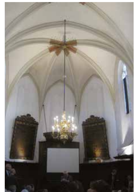
De conferentie werd gehouden in de naburige kerk, die in de middeleeuwen de kerk van de begijnen was. Velen van hen liggen er nog steeds begraven.