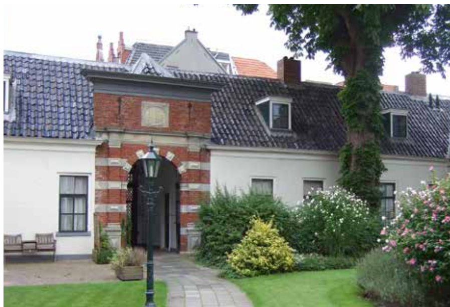
Sint Anthony Gasthuis te Groningen.